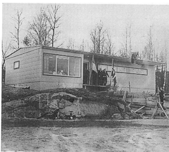
Det nye klubbhuset - ferdig i 1965. Her fra åpningen.

Planene ble behandlet og godkjent på et styremøte 13. juni 1963 og allerede 24. november samme år var grunnmuren ferdig. 29. april 1965 ble det nye klubbhuset innviet med gjester fra fotballforbund, fotballkrets og den lokale pressen. Totalt kostet bygget 67.000 kroner. Foreningen hadde nå fått eget hus med garderober, varmt og kaldt vann, wc, bad, vask, kjøkken og møtesal.